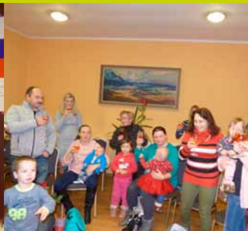
Slávnostné uvítanie novorodencov do života