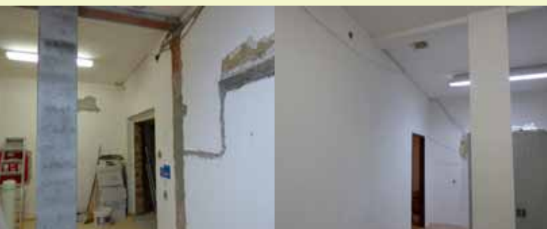
Rekonštrukcia registratúrneho strediska

Najčastejšie sa vyskytujúce druhy invázných rastlín: Boľševník obrovský (Heracleum mantegazzianum), Pohánkovec japonský (Fallopia japonica), Zlatobyľ obrovský (Solidago gigantea).