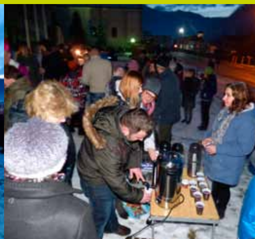
Zapálenie sviečok na Vianočno stromčeku