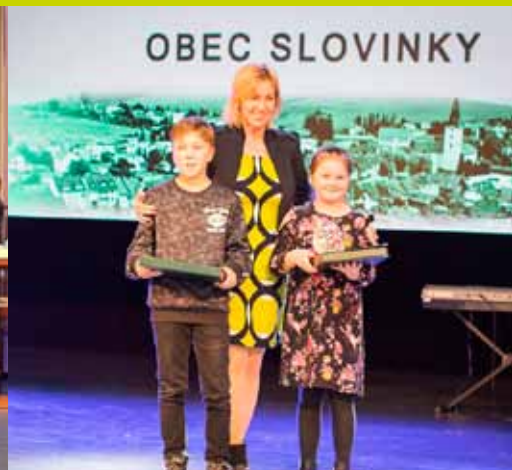
Najúspešnejší športovci regiónu Spiš za rok 2018