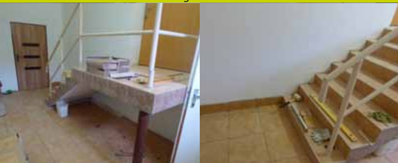
Rekonštrukcia vstupu na javisko